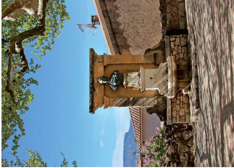
Le Val Sillons-sources-Argens Le château de Tourves Le musée des Grottes Digne et Tourves

Le Point Accueil, place du 4 septembre, est ouvert pour tout renseignements de 9h à 17h et de 14h à 06 44 12 86 00.