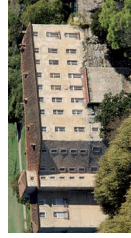
Le château d'Autrechaux Saint-Martin-de-Pallières Le castrum de Saint-Jean de Rougiers